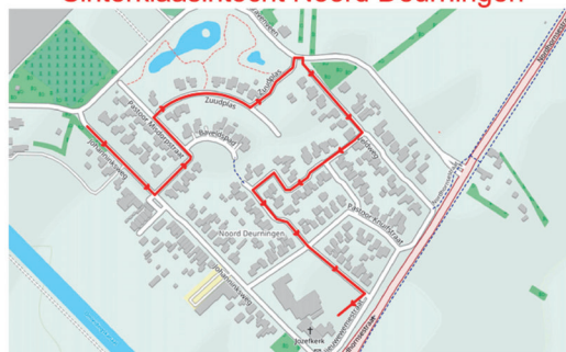
Sinterklaasintocht Noord Deurningen