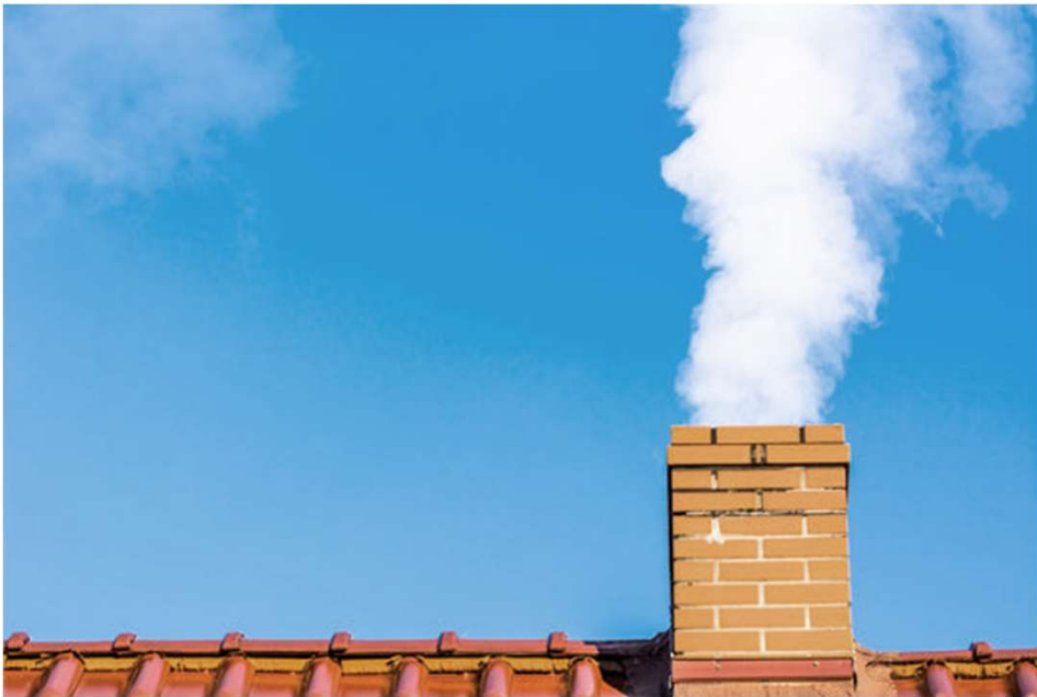
Voor inregelen CV